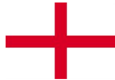
(Bandera de SAN JORGE)