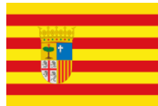
(Bandera de ARAGÓN)